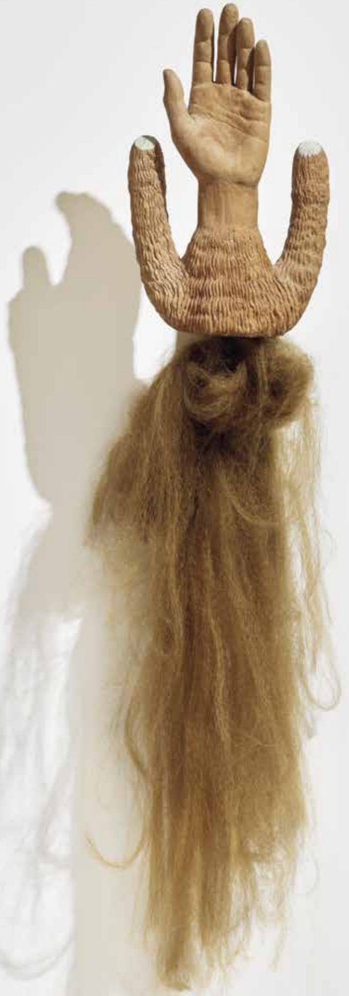
17 — Untitled (Wistful Eye), 2018/2020