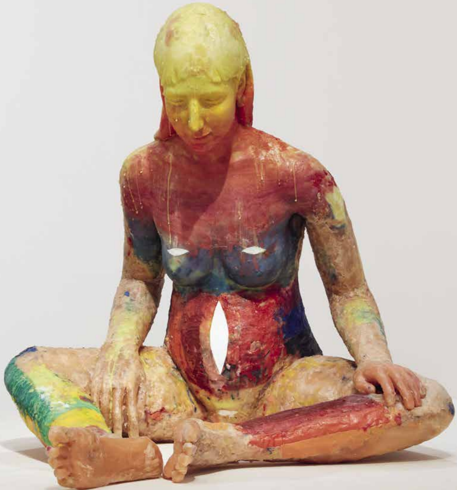
22/23 — Rainbow Woman II, 2021