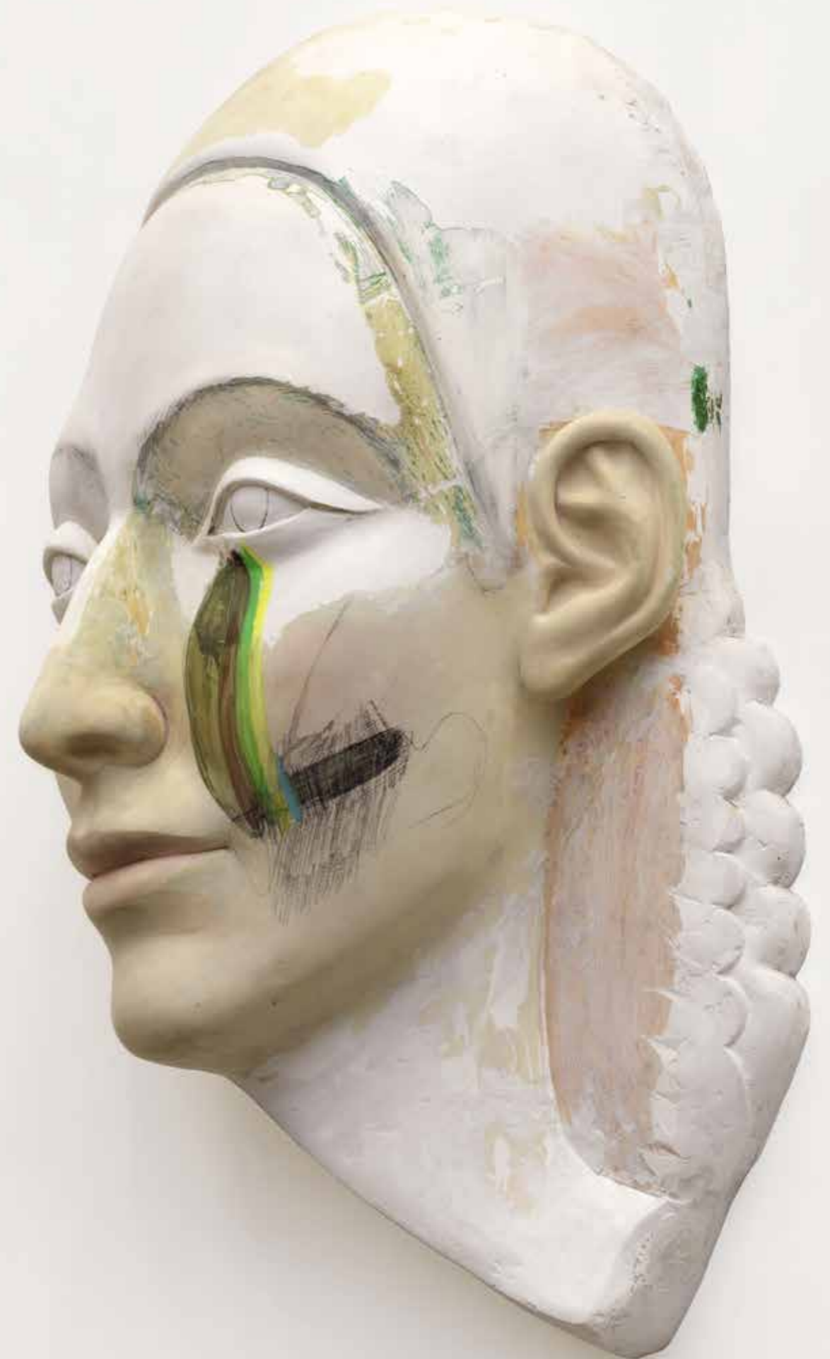
9/11 — Untitled, 2012/2020