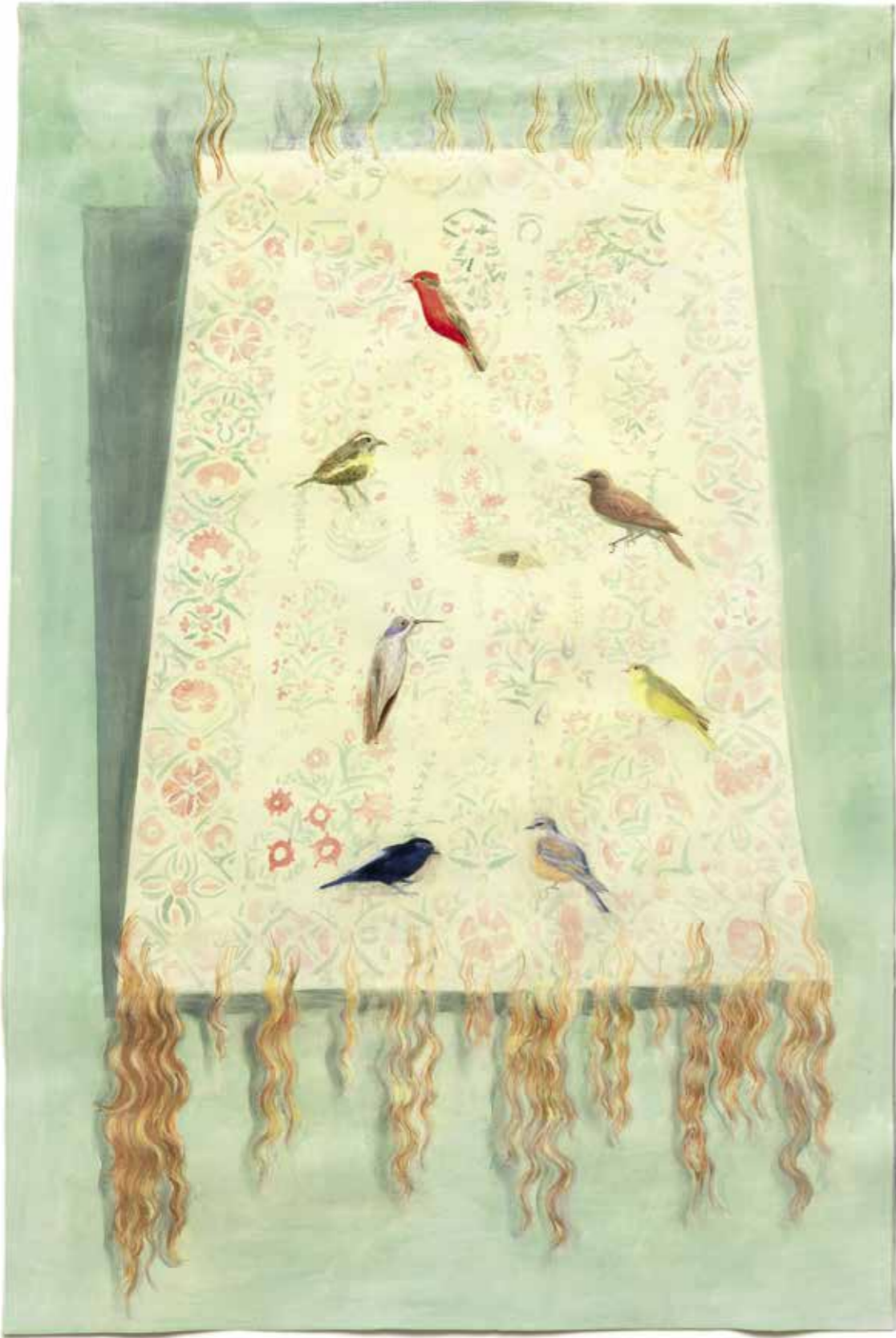
10 — Only birds should tweet, 2018