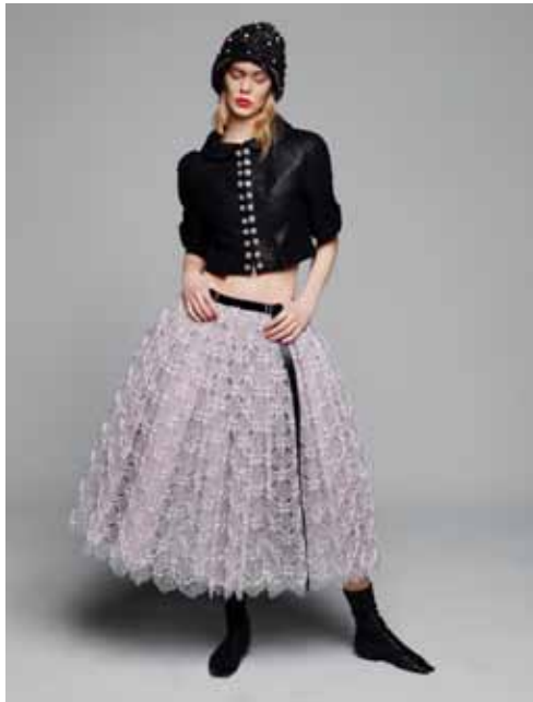
Ensemble avec jupe en dentelle mécanique perforée à la main. Karl Lagerfeld pour CHANEL Collection Haute Couture Printemps-Été 2015

exposition candidate au label d'exposition d'intérêt national