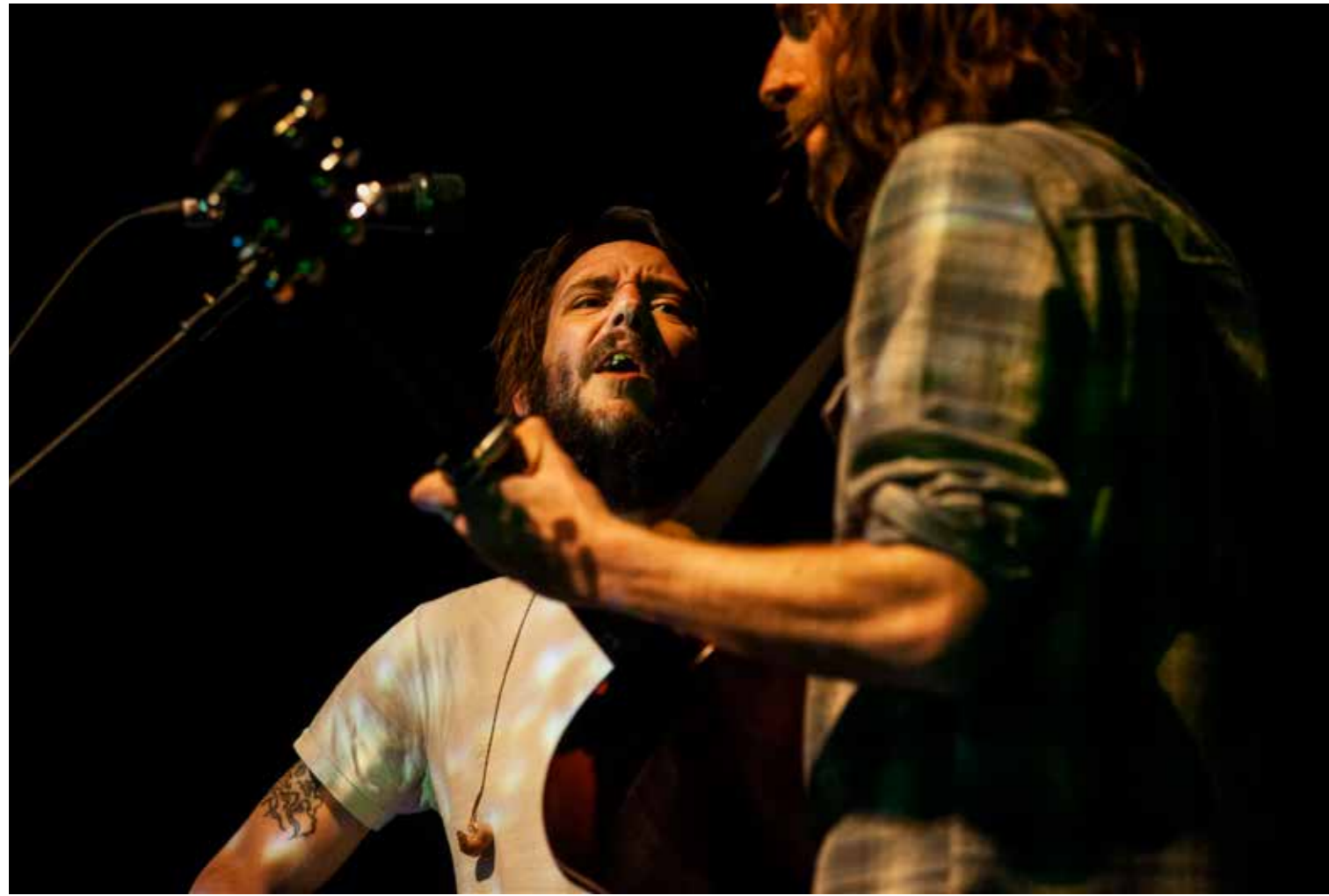
Band Of Horses Arsenal