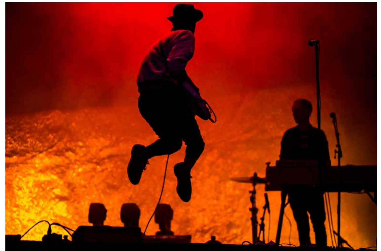
The Van Jets