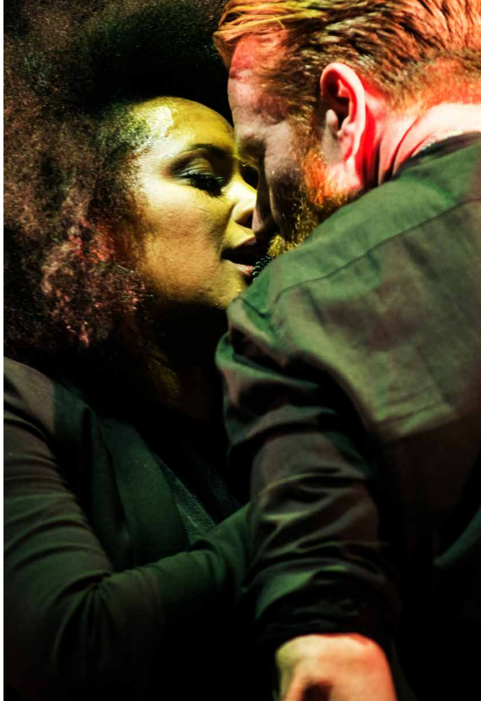
Botanique 2011 Lotto Arena 2014