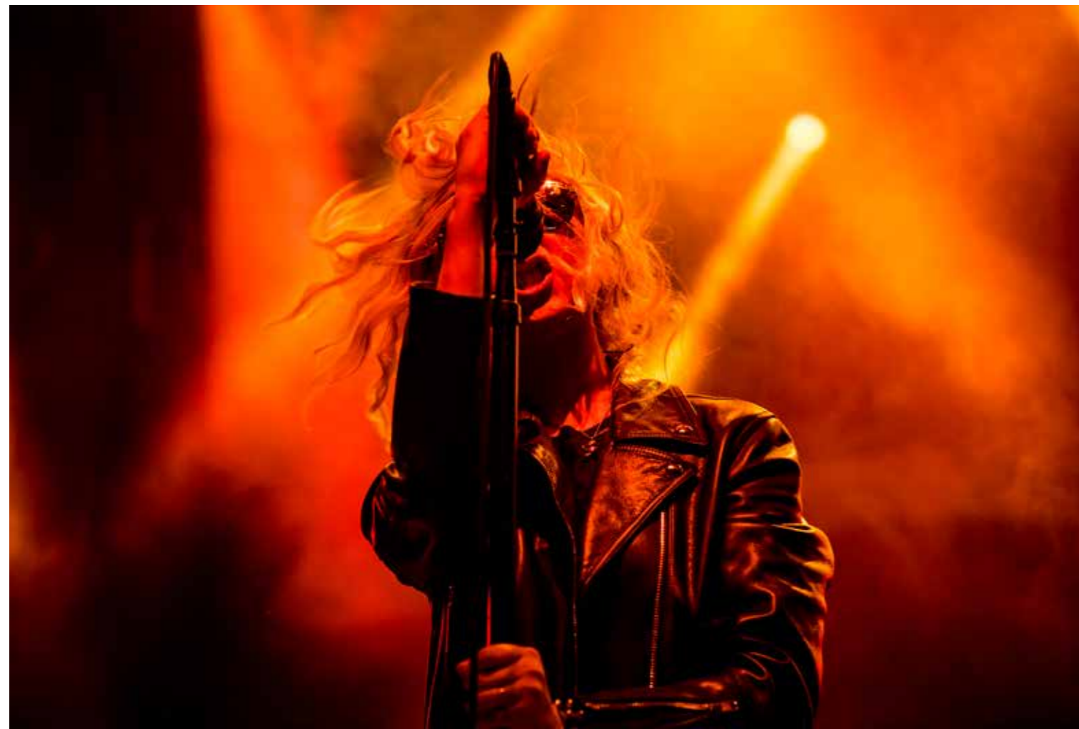
The Pretty Reckless