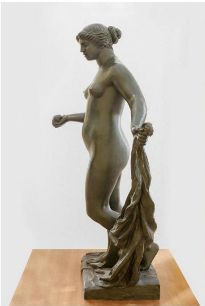
Pierre Auguste Renoir et Richard Guino Vénus Victrix , 1914-1916, Paris, musée du Petit Palais