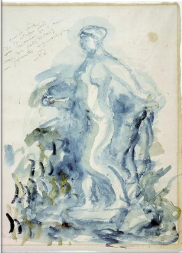
Pierre Auguste Renoir Etude pour la Vénus Victrix , 1914, Paris, musée du Petit Palais